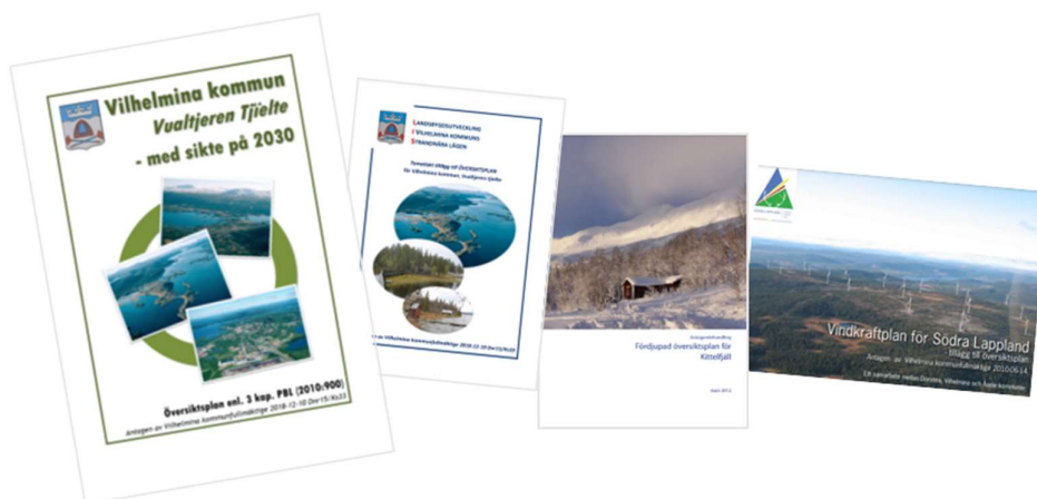
Vilhelmina kommuns gällande översiktsplan; Kommuntäckande översiktsplan, LIS-plan, Fördjupad översiktsplan för Kittelfjäll och Vindkraftplan för Södra Lappland.

Den fördjupade översiktsplanen för Kittelfjäll samt Vindkraftsplanen aktualiserades i samband med att den kommuntäckande översiktsplanen och LIS-planen antogs i december 2018.