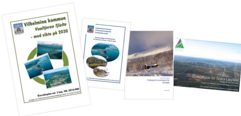
Vilhelmina kommuns gällande översiktsplan; Kommuntäckande översiktsplan, LIS-plan, Fördjupad översiktsplan för Kittelfjäll och Vindkraftplan för Södra Lappland.

Den fördjupade översiktsplanen för Kittelfjäll samt Vindkraftsplanen aktualiserades i samband med att den kommuntäckande översiktsplanen och LIS-planen antogs i december 2018.